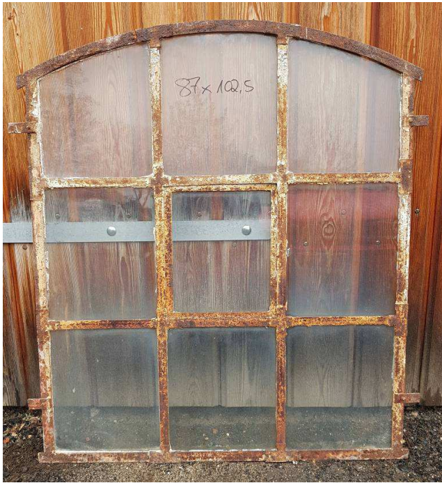
3 x 87 x 102,5 cm 150,00€ Stück